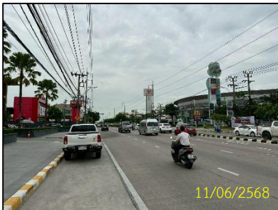
ทิศตะวันออก (ห้างสรรพสินค้า แมคโคร)