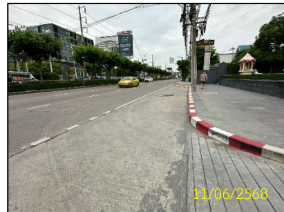
ทิศตะวันตก (บริษัท แด็กชิน (ประเทศไทย) จำกัด)

ภาพที่ 1-2 อาณาเขตติดต่อโดยรอบพื้นที่โครงการ