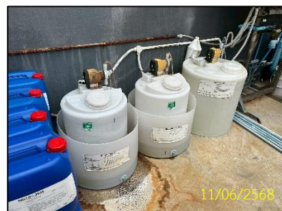
ภาพที่ 1-1 ภาพการดำเนินโครงการในปัจจุบัน