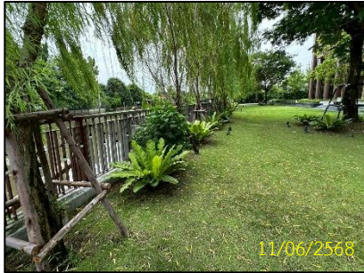
ทิศเหนือ (คลองประเวศบุรีรมย์)